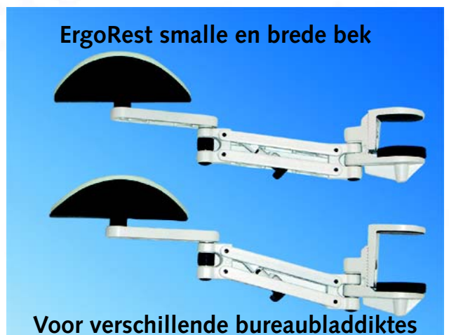
Voor verschillende bureaubladdiktes